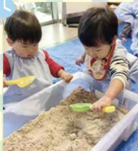
すなをほるのはたのしいな